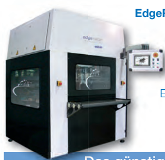
Das günstige Modell

Der einseitige EdgeRacer ER 1500 E: Für alle, die eine kostengünstige Anlage zur perfekten Entgratung suchen.