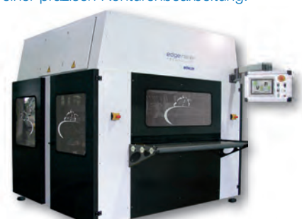
Die beidseitige Anlage

Beidseitiges Entgraten in nur einem Durchgang, das kann unser EdgeRacer ER 1500 D – natürlich mit 100% reproduzierbaren Ergebnissen und einer präzisen Konturenbearbeitung.